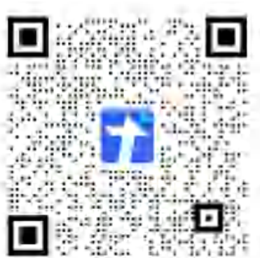
新生勤工助学预报名