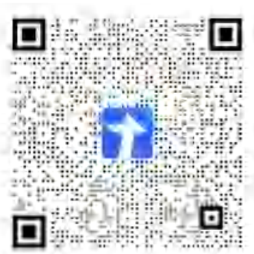
新生学生干部预报名