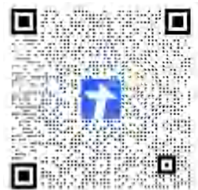
武装部新生退伍兵预报到