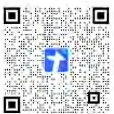
新生艺术表演活动预报名