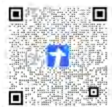
新生迎新志愿者预报名