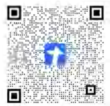
新生拍摄工作爱好者预报名