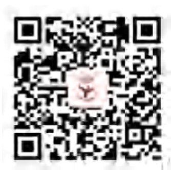
岭南学生社区公众号